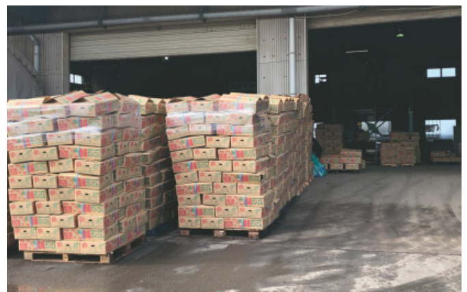
▲洗浄選別施設において箱詰めされ出荷を待つだいこん