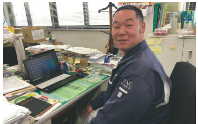
▲地引さんの「Z-GIS」管理はPCが中心